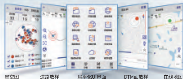
星空图 道路放样 扁平化UI界面 DTM面放样 在线地图